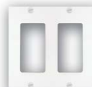
placa decora 2 unidades 80409

Colores Terminación ooW: Blanco ool: Marfil ooT: Almendra Claro